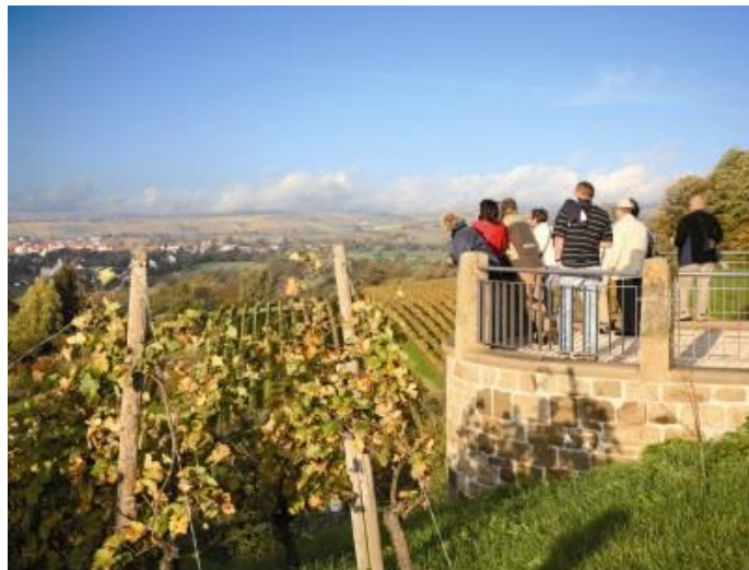
Blick über den Kraichgau vom Derdinger Horn, Oberderdingen

Presseinformation: Thea Lochmann, Tel.: 07252 9633-22, lochmann@kraichgau-stromberg.com .