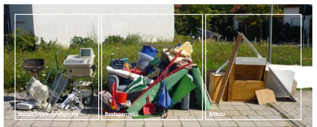
So ist es richtig! Bitte stellen Sie Ihren Sperrmüll sortiert zur Abholung bereit.