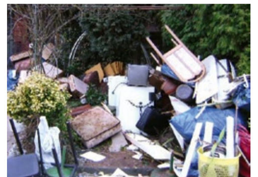
So bitte nicht! Ein unsortierter Sperrmüll führt zu vielen Problemen bei der Abfuhr.

Bitte beachten Sie auch die umfangreichen Infos zur Sperrmüllabfuhr in Ihrem Müllwegweiser sowie im Internet auf www.awb-landkreis-karlsruhe.de