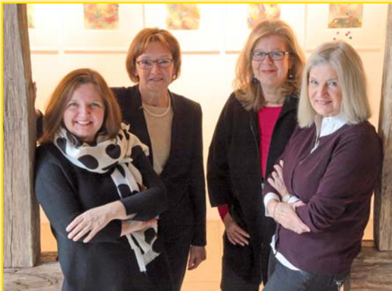
Vorstandschaft KulturDreieck Oberderdingen e.V.

An allen Veranstaltungen bewirbt Sie der Verein KulturDreieck Oberderdingen e.V